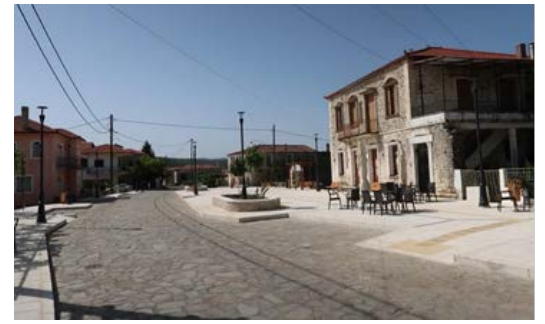
Η ανακαινισμένη πλατεία της Ράχης

Ενημερωτικό Δελτίο του Συνδέσμου των Απανταχού Καρυατών